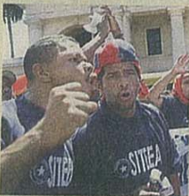
PASE A LA 50A