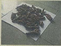
PASE A LA 44A